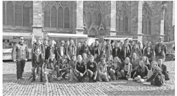
Das Foto zeigt die Austauschschüler vor dem Freiburger Münster.

Gemeinsamkeiten und Unterschiede im täglichen Leben oder im Schulalltag in Frankreich und Deutschland. In der jeweiligen Fremdsprache zu kommunizieren, war dabei eine besondere Herausforderung. Die Austauschgruppe arbeitete gut und konnte die 7. Klassen mit ihren Ergebnissen beeindrucken. Auf dem Ausflugsprogramm standen der Besuch der Stadt Rottweil mit Stadt-Rallye zu Kultur und Geschichte, sowie Entspannung im Aquasol. Zur Landesgeschichtlichen Erkundung Baden-Württembergs gehörten die Besichtigung des Schlosses in Sigmaringen und eine Stadtführung in Freiburg mit ausführlichen Informationen zum Stadtkern rund um das Münster. Am letzten Tag lag der Schwerpunkt auf dem Unterricht und den Präsentationen der gemeinsam vorbereiteten Projekte. Die französischen Schüler haben einige Unterschiede bezüglich Schulsystem, Unterricht und Räumlichkeiten festgestellt. Einen Pluspunkt konnten sie für sich verbuchen: Die französischen Schüler dürfen das Handy auf dem Schulhof benutzen. Ein harmonisches Abschlussfest am Freitagabend rundete die Austauschwoche auf dem Heuberg ab.